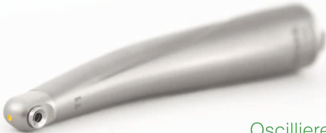
Oscillierendes EVA Winkelstück